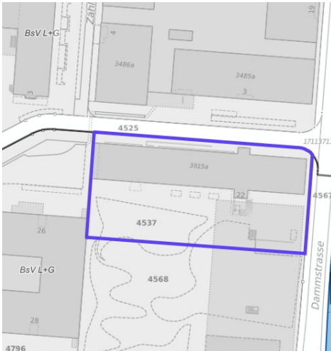
Abb. 1: Perimeter städtischer Grund vor dem Stadthaus Zug an der Gubelstrasse 22, 6301 Zug