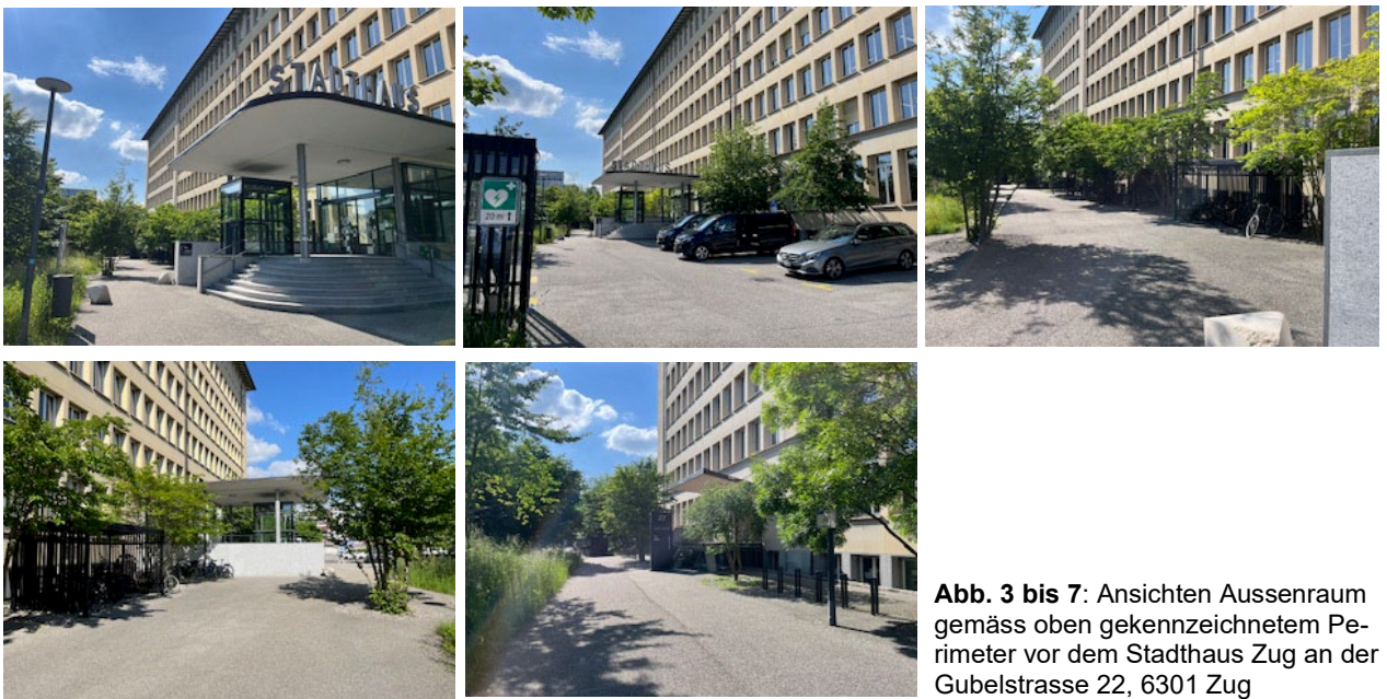
Abb. 3 bis 7: Ansichten Aussenraum gemäss oben gekennzeichnetem Perimeter vor dem Stadthaus Zug an der Gubelstrasse 22, 6301 Zug