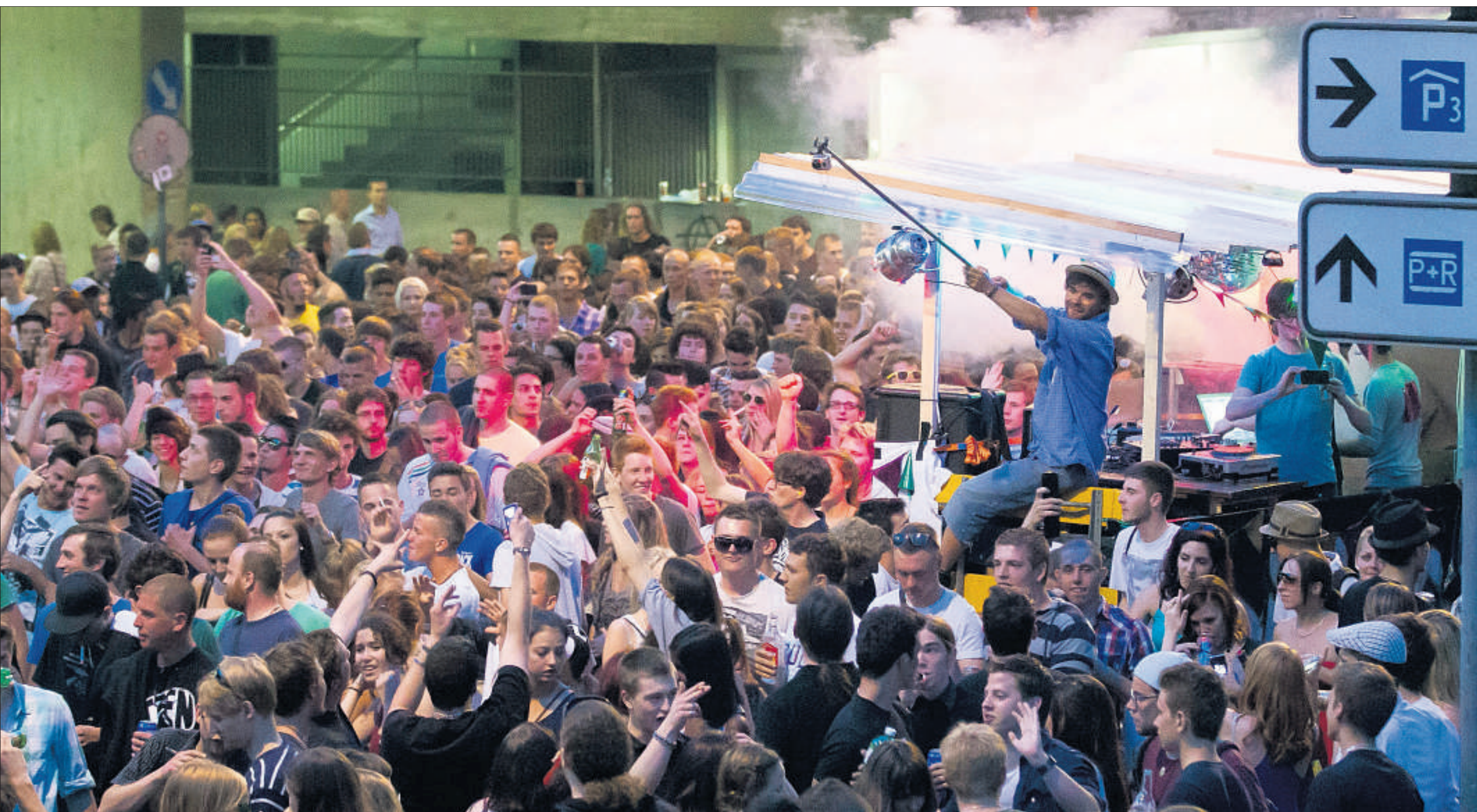
«Tanz dich frei», heisst das Motto: Tausende junge Leute bewegen sich, von Musikwagen begleitet, an einem unbewilligten Anlass durch die Innenstadt von Bern. (Samstag, 2. Juni 2012)