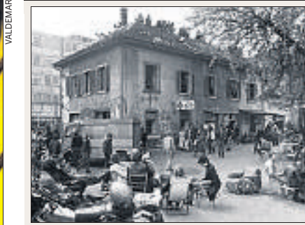
Zürcher Jugendzentrum, um 1981.