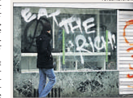
Demo von Jugendlichen, Zürich 2010.

Die Bewegung zur Aneignung des öffentlichen Raums ist globalisierungskritisch und führt Strassenpartys und Velofahrten in Städten durch. In Zürich kommt es im Februar 2010 nach einer Strassenparty zu Ausschreitungen mit Verwüstungen. Aus Spanien schwappt der Brauch der Botellones in die Schweiz über: Tausende Jugendliche treffen sich auf öffentlichen Plätzen zum gemeinsamen Konsum alkoholischer Getränke. Die Mobilisierung findet über das Internet statt. Nach einem Massenbesäufnis mit rund 2000 Teilnehmern bleiben im August 2008 auf einer Wiese am Zürichsee rund sechs Tonnen Abfall zurück. Die Veranstalter werden in den Medien scharf kritisiert. (be.)