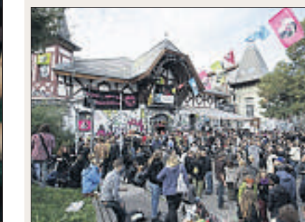
Feier in der Berner Reithalle, 2010.

Das «Freie Land Zaffaraya», ein Zelt- und Wagendorf, wird 1987 von der Berner Polizei geräumt. In der Folge kommt es in der Stadt zu Unruhen. Die Jugendlichen besetzen die Reithalle beim