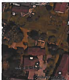
Situation Google Map

Am 16.8.2022 ist in der Zugerzeitung unter dem Titel: «Plan B für Guthirt-Schulkinder: Der geplante Pavillon am Lüssiweg steht nicht» ein aufschlussreicher Zeitungsartikel erschienen. Weiter war zu lesen: «Um der Knappheit an Schulraum in Zug entgegenzuwirken, sollte ein Gebäude für zwei Kindergarten- und zwei Primarklassen erstellt werden. Das Projekt lag zweimal auf, das grüne Licht für die Realisierung steht kurz vor Schulbeginn immer noch aus». Ende Zitat.