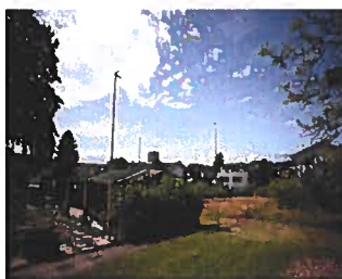
Bild Zugerzeitung mit Bauprofilen