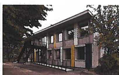
Zuger Modul (Modular-Zug) Blumer-Lehmann