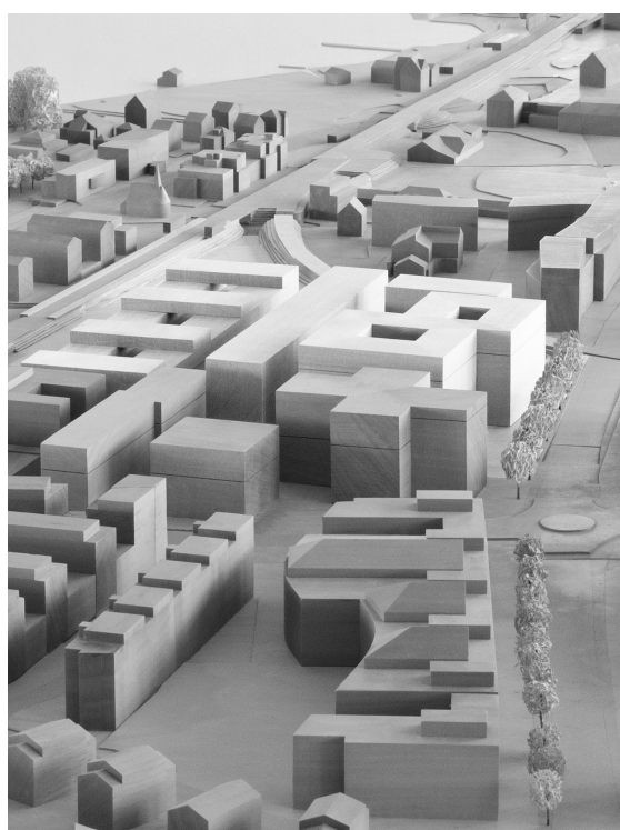
Abb. 2: Richtprojekt (Blick von Osten)