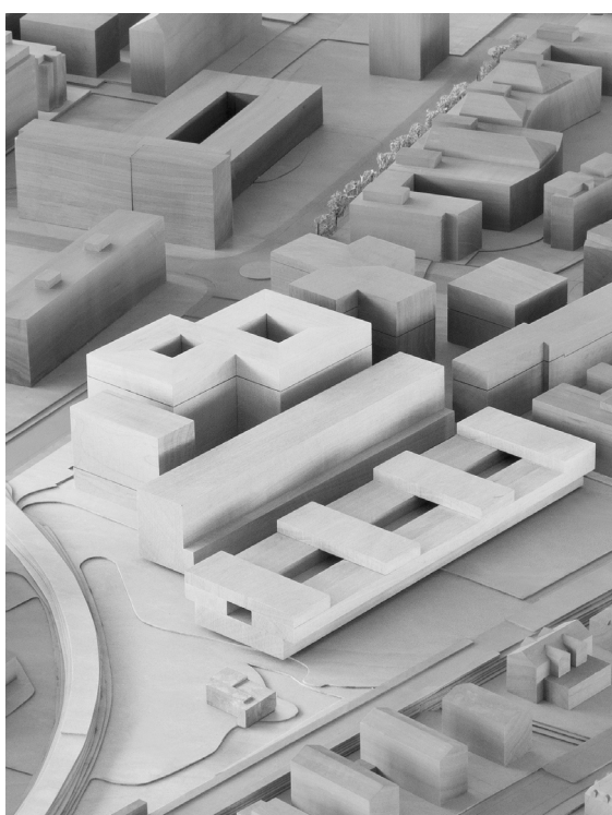
Abb. 1: Richtprojekt (Blick von Südwesten)