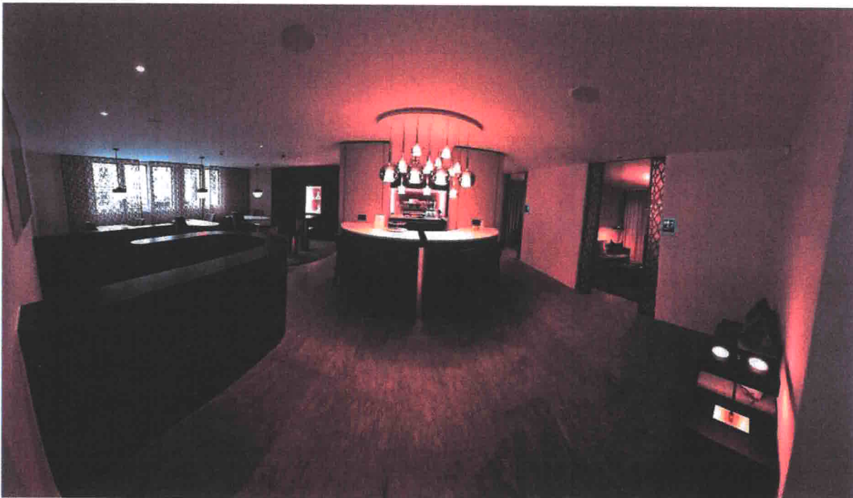
Abbildung 2: Ehemalige Schaltherhalle