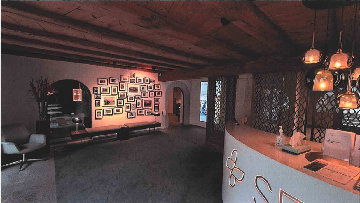
Abbildung 1: Eingangsbereich mit Empfang