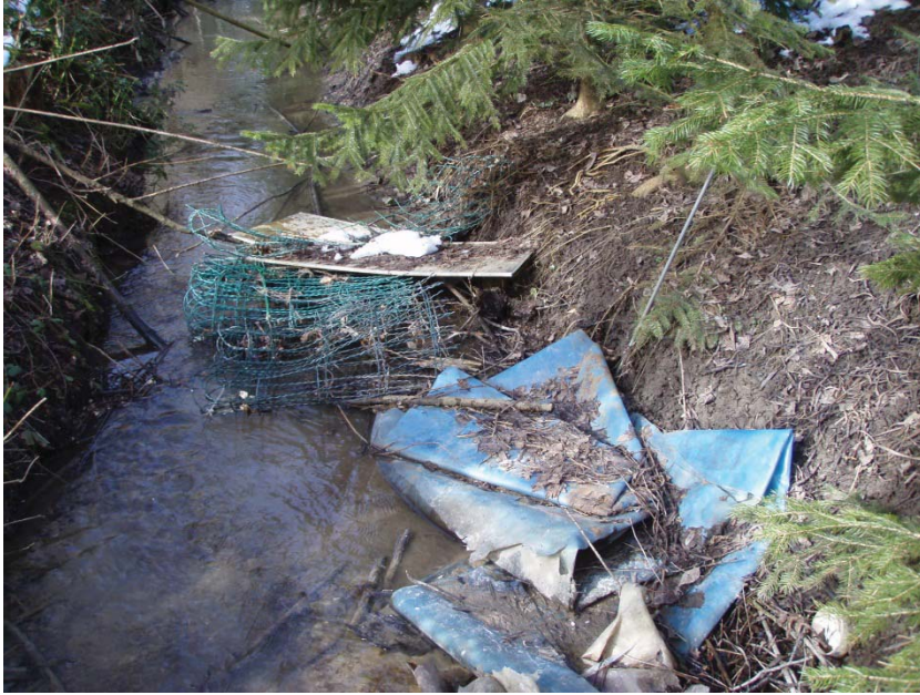
7. Verunreinigungen im Bach