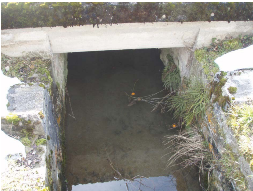
21. Strassenunterquerung Schleifi