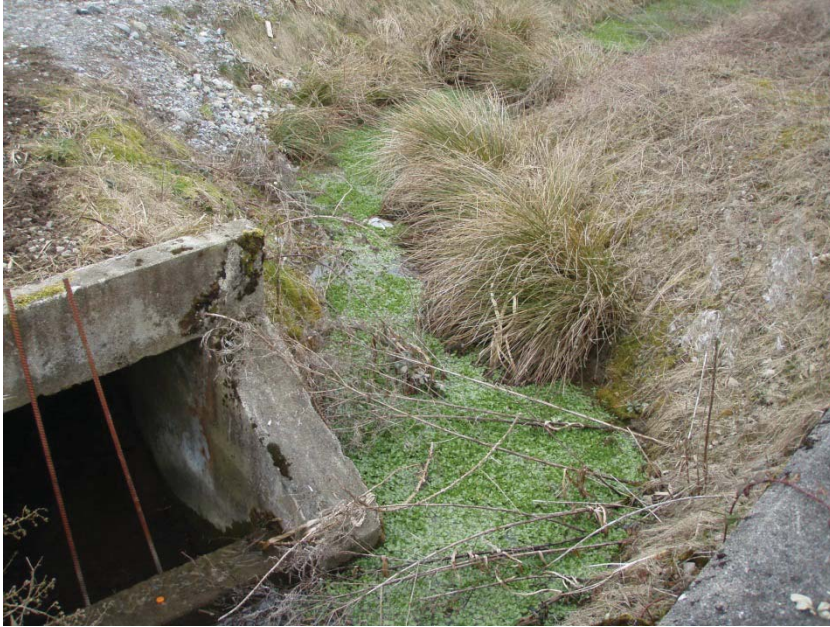
22. Einlauf Hochwasserentlastungskanal und Stampfibach entlang Überbauung Feldpark