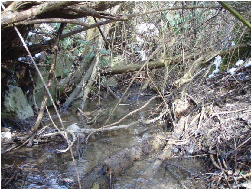
14. Bach nach Eindolung, Blick gegen Fließrichtung