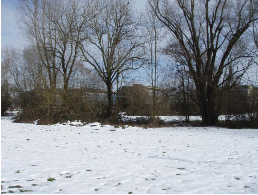
19. Bach von aussen, Abschnitt vor Strassenunterquerung Schleifi