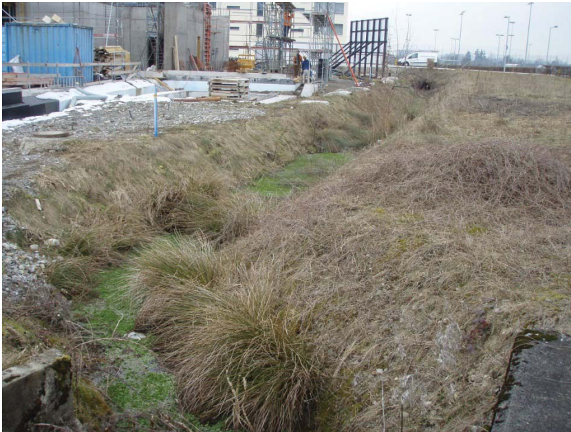
23. Stampfibach entlang Überbauung Feldpark