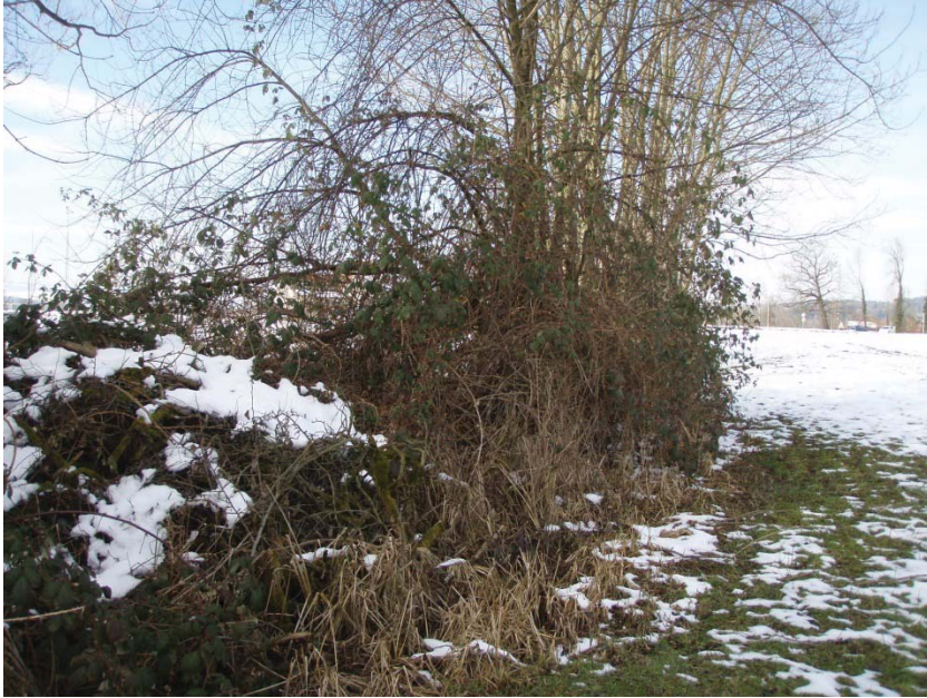
16. Bach von aussen, Abschnitt nach Eindolung