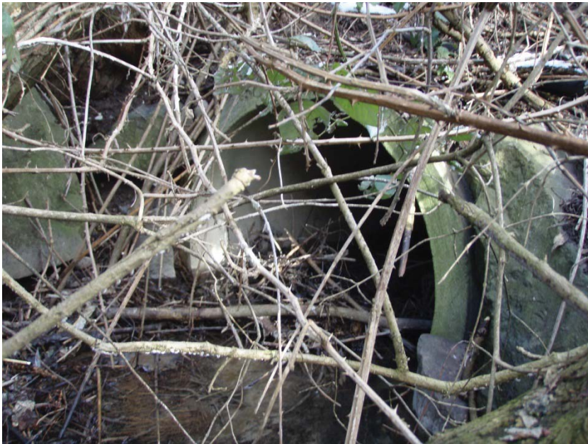
11. Auslauf Eindolung