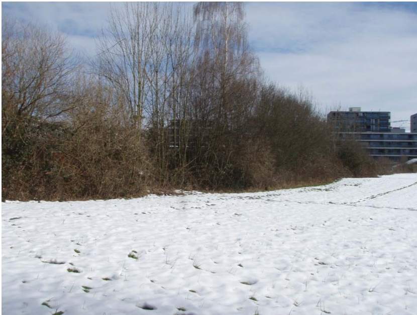
8. Bach von aussen, Abschnitt nach SBB-Gleisen