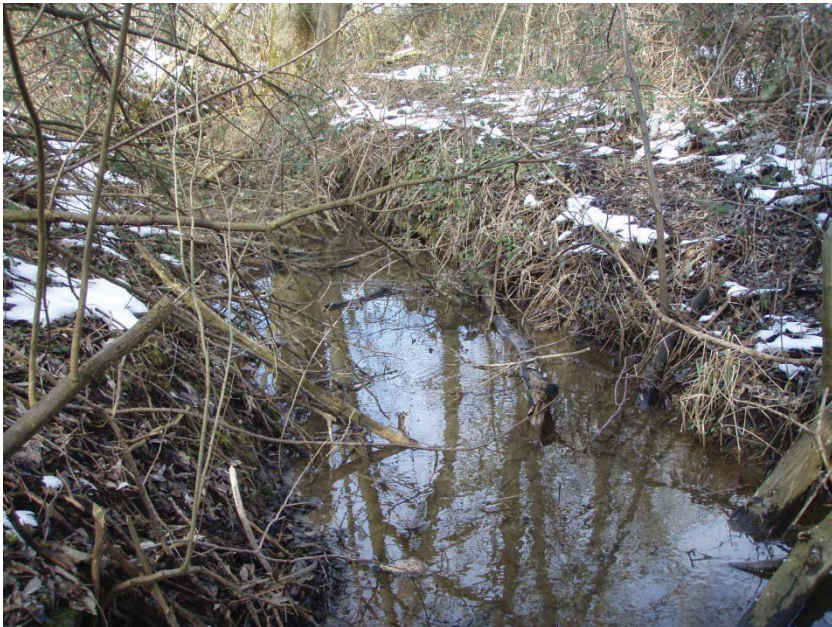
17. Bach vor Strassenunterquerung Schleifi, Blick gegen Fließrichtung