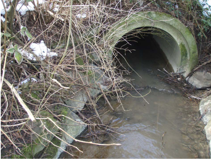
10. Einlauf Eindolung