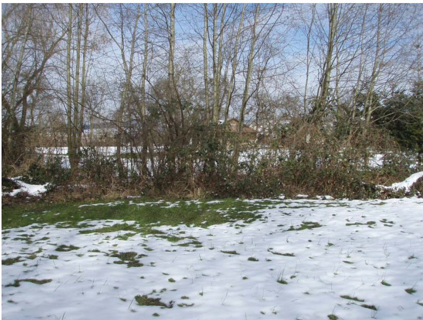
12. Gelände über Eindolung